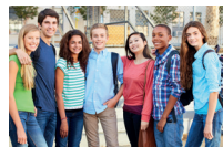
het voortgezet onderwijs secondary school