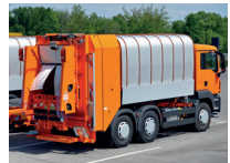
de vuilniswagen dustbin lorry