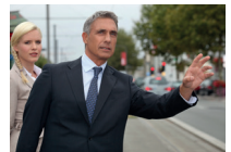
een taxi aanroepen to hail a taxi