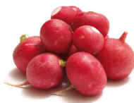
het radijsje radish