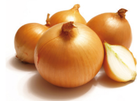
de ui onion