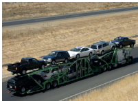
de autotransportwagen car transporter