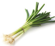
de lente-ui spring onion