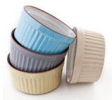
de ramequin ramekin