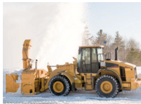
de sneeuwrees snow blower