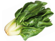
de snijbiet Swiss chard