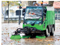
de straatveegmachine street sweeper