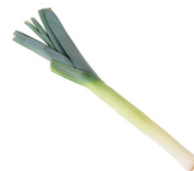
de prei leek