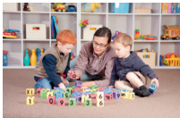
de kleuterklas la scuola materna