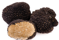
de truffel il tartufo