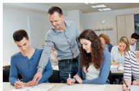
het gymnasium/atheneum il liceo