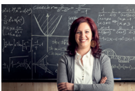
de lerare l'insegnante