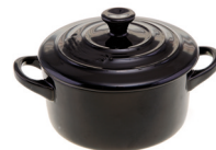
de stoofpan la casseruola