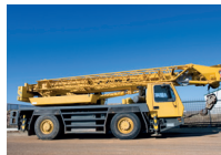
de mobiele kraan l'autogru