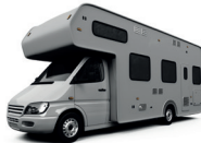
de camper il camper