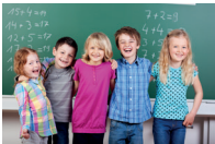
de basisschool la scuola elementare