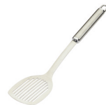
de bakspatel la spatola da cucina