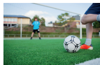
het sportveld il campo sportivo