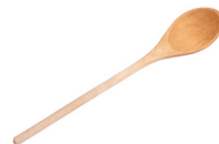
de pollepel il mestolo