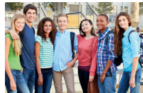
het voortgezet onderwijs la scuola secondaria