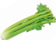
de bladselderij il sedano