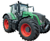
de tractor il trattore