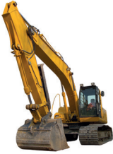
de graafmachine l'escavatore