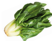
de snijbiet la bietola