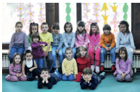
de klas la classe