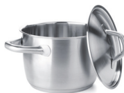
de kookpan la pentola