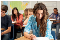
het examen l'esame