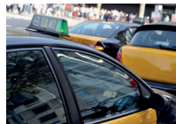
de taxistandplaats il posteggio taxi