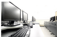
de computerruimte il laboratorio multimediale