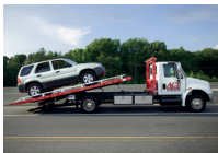
de sleepwagen il carro attrezzi