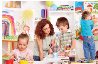
de peuterspeelzaal l'asilo d'infanzia