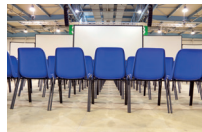
de aula l'aula magna